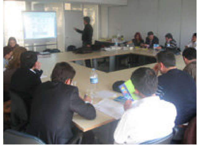
18 Nisan 2009 Eğitiminden bir görünüm (Yer İTÜ, Maslak)

AB projelerinde ortaklık olmazsa olmaz şartı. Her proje sahibi projesi için AB ülkelerinde ve aday statüsünde olan Türkiye'den ortak aramakta. Bu eğitimle AB projelerine ortak olmak için yapılması gerekenleri katılımcılara aktarıyoruz.