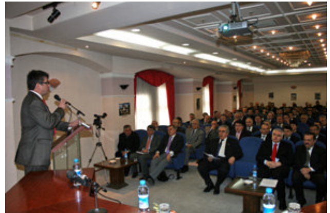
Kastamonu Valiliği Konferans programı

Değişik illerde valilik, kaymakamlık ve belediye gibi kurum elemanlarına özel eğitimler veriyoruz. Diyarbakır valiliği, Kastamonu valiliği, Tokat valiliği, onlarca kaymakamlık, belediye ve işletme hizmetlerimizden faydalandı.